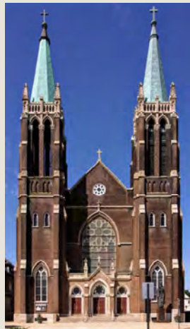
St. Mary of Czestochowa Church 3010 South 48th Ct. Cicero, IL 60804