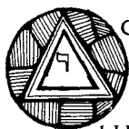
Gloria al Padre

Jesús nos reveló más plenamente al Padre. Siempre hablaba de su Padre llamándole por este nombre. Nos enseñó a amar a nuestro Padre celestial