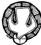
al Espíritu Santo